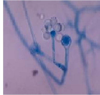
Figure 2. Appearance of Cunninghamella sp. Microscopically.