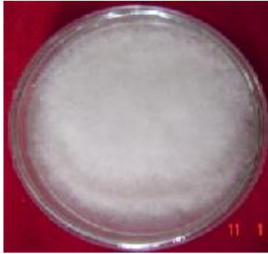
Figure 1. Appearance of Cunninghamella sp. Macroscopically.